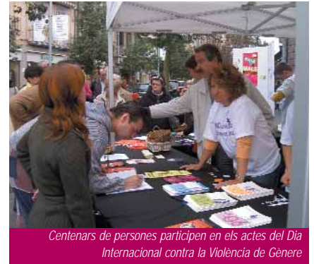
Centenars de persones participen en els actes del Dia Internacional contra la Violència de Gènere

Els actes organitzats els passats 24 i 25 de novembre amb motiu del Dia Internacional contra la Violència de Gènere es van tancar amb una gran afluència de públic. Cal destacar la marxa que va tenir lloc el dia 24 en què van participar prop d'un centenar de persones. D'altra banda, el dia 25 la Comissió contra la Violència Domèstica va muntar dos estands - un a la plaça de Josep Tarradellas i un altre al costat del Mercat de Sant Adrià (a la imatge) - que van ser visitats per molt ciutadans i ciutadanes. L'objectiu d'aquests estands era sensibilitzar la població de la gravetat del problema de la violència de gènere, com també donar informació sobre recursos i serveis adreçats a les dones que pateixen maltractaments. Es van llegir dos manifestos: el manifest unitari que per primer cop es va fer entre totes les institucions catalanes i el manifest de la Comissió contra la Violència Domèstica de Sant Adrià. ■