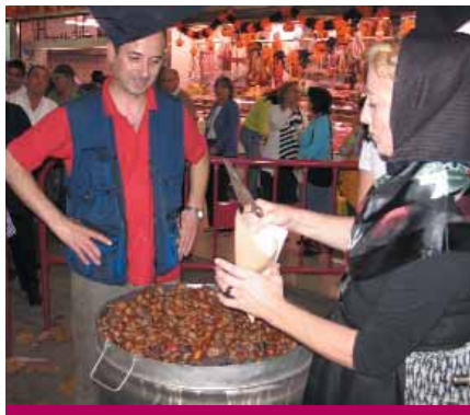
Castanyada al Mercat

El 27 d'octubre el Mercat de Sant Adrià va ser escenari d'una castanyada popular, que va comptar amb una gran assistència de públic. Els comerciants havien regalat durant la setmana tiquets per convidar la seva clientela a la castanyada.