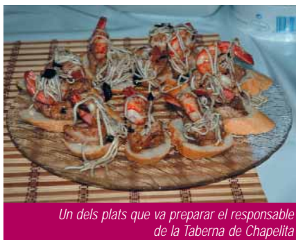
Un dels plats que va preparar el responsable de la Taberna de Chapelita

L'Ajuntament de Sant Adrià de Besòs juntament amb la Federació d'Associacions de Comerciants (FACOSA) i el Mercat Municipal va organitzar fa unes setmanes la campanya "A Sant Adrià trobes bon menjar". L'objectiu d'aquesta acció era, d'una banda, difondre la importància de la varietat alimentària i el paper clau de determinats aliments en la promoció de la salut i, d'altra banda, donar a conèixer les