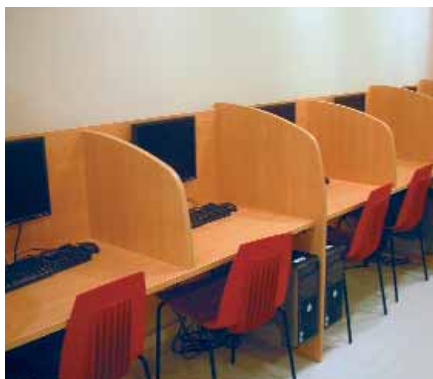
Imatge de la nova instal·lació del Centre de producció Cultural i Juvenil Polidor

Centre de producció cultural i juvenil Polidor Rambleta, s/n – 93 462 74 46 (al costat del Poliesportiu Ricart) de dilluns a divendres de 17 a 22 h polidor@sant-adria.net