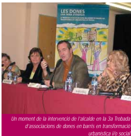
Un moment de la intervenció de l'alcalde en la 3a Trobada d'associacions de dones en barris en transformació urbanística i/o social

El 17 i 18 de novembre va tenir lloc la tercera Trobada d'associacions de dones de barris en transformació urbanística i/o social, que organitza l'Associació per a la Promoció de Dones de la Mina Adriaes amb el suport de l'Ajuntament. Amb el nom de Les dones, una mina d'energia , la trobada ha esdevingut, com en anys anteriors un interessant espai per reflexionar