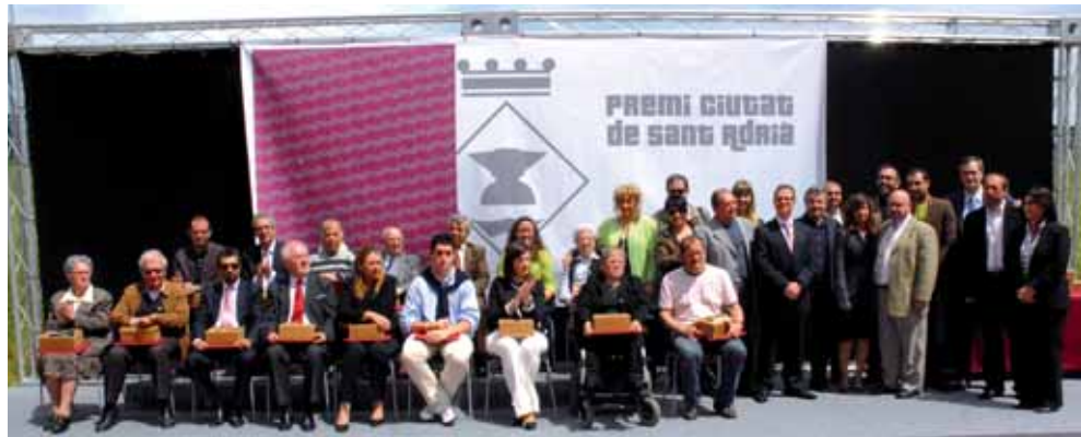
Els guardonats amb els membres de la corporació adrianea