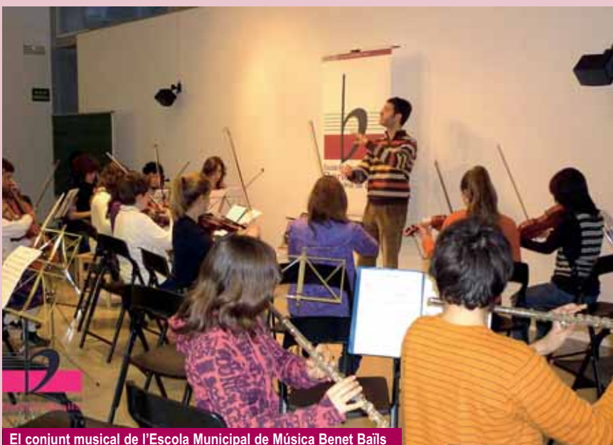
El conjunt musical de l'Escola Municipal de Música Benet Bails

La data límit per rebre material serà el 30 d'abril de 2010 i el resultat del concurs es farà públic en una acte que se celebrarà el mes de juny i que serà comunicat per correu electrònic a les persones participants.