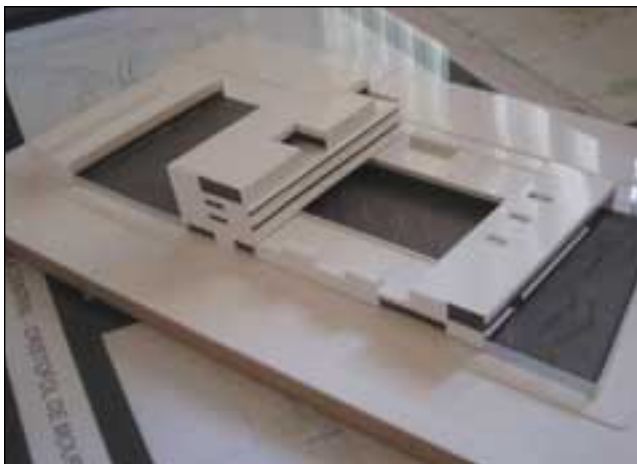
Maqueta del CEIP Fòrum 2004

La nueva escuela será de uso común para los vecinos, más allá del horario escolar. El gimnasio es una sala polivalente que se puede utilizar de sala de actos, las pistas polideportivas estarán abiertas a todo el barrio y la biblioteca tendrá una entrada independiente, en definitiva un equipamiento moderno que estará preparado para recibir el año que viene el gran acontecimiento del Fórum 2004.