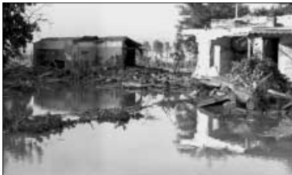
Cases destruïdes i pèrdua de vides humanes foren les conseqüències més greus de les besossades de setembre i novembre de 1962