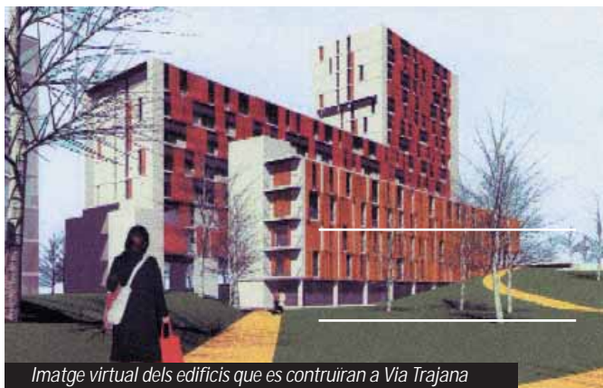
Imatge virtual dels edificis que es construiran a Via Trajana