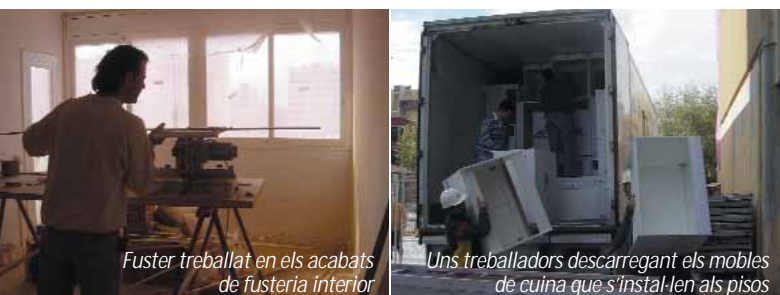
Fuster treballant en els acabats de fusteria interior