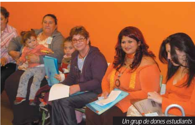
Un grup de dones estudiants

La clau sembla estar en el suport del mateix col·lectiu femení, per no tenir la sensació d’estar sola lluitant contra estereotips i models enquistats que sovint es justifiquen en la cultura gitana. Les mares i àvies, transmissores de valors dins la família, parlen d’integrar cultura i tradició amb la nova realitat que afronten les joves, sense que coartïn les legítimes aspiracions de les seves filles a decidir quin paper volen tenir laboralment i social.