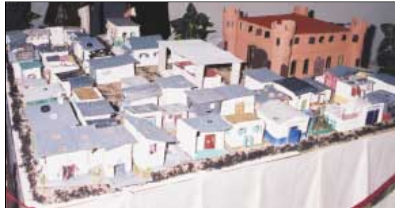
Maqueta del Camp de la Bota realitzada per l'Associació de Dones Adrianes de la Mina