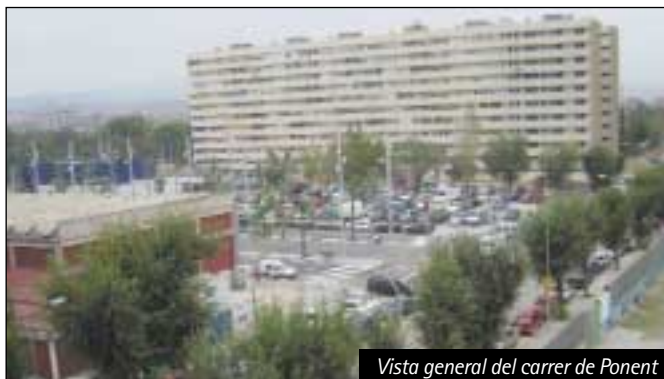
Vista general del carrer de Ponent

Durant aquest temps es podran seguir utilitzant les zones d'aparcament provisional que estan habilitades al costat de la Rambla i al solar que hi ha al costat de la nova escola del carrer del Mar.