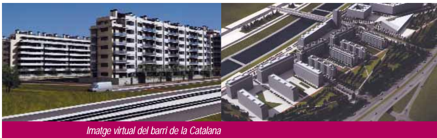
Imatge virtual del barri de la Catalana

La urbanització del primer sector durarà dos anys i després s'encetarà la segona fase, que afectarà al sector comprès entre Cristòfol de Moura i la via del tren.