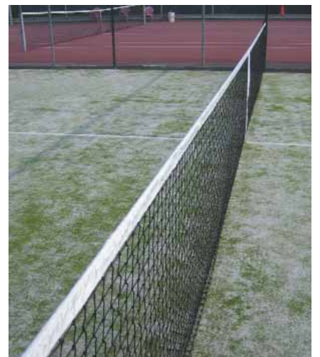
La nova pista de padel al Club Tennis Sant Adrià

que fan que la pràctica del tennis tant en nivells inicials com de competició sigui molt gratificant. El Club, a través de la Federació Catalana de Tennis, disposa de tècnics d'alt nivell per desenvolupar cursos de formació tant infantils com per a adults. ■