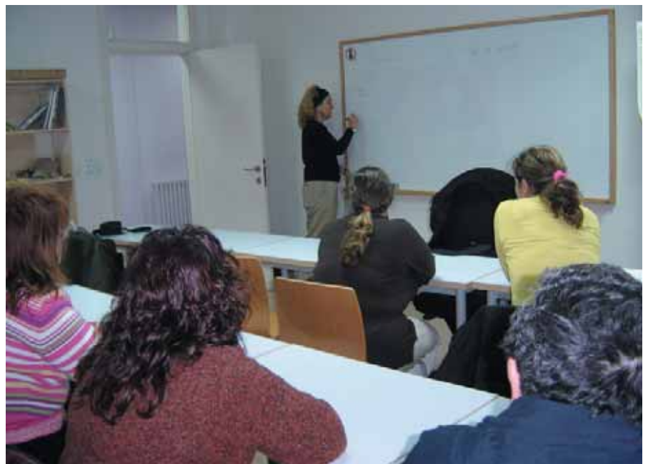
Els comerciants del Besòs assisteixen a seminaris especialitzats sobre promoció comercial

Sessió 6: Quan cal fer actuacions de comunicació i promoció en el punt de venda. Les implicacions amb el producte i servei ofert. ■