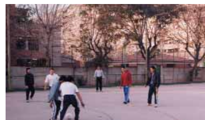
Imatges actuals dels poliesportius Ricart i Mina