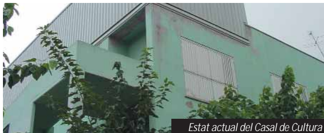
Estat actual del Casal de Cultura

es remodelarà la façana de l'edifici, que presenta algunes esquerdes. Finalment, i seguint el criteri de promoure l'accessibilitat a tots els col·lectius, l'Ajuntament adaptarà els lavabos per facilitar-ne l'ús a les persones amb dificultats de mobilitat.