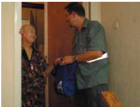
Un treballador municipal portant l'àpat a una usuària del servei

A mitjans dels anys 90 els Serveis Socials municipals van engregar la implantació dels serveis de proximitat amb la teleassistència. Posteriorment es va incorporar a la nostra cartera de serveis la neteja de manteniment, l'àpat a domicili i els arranjaments. Paral·lelament s'oferia, des de feia ja anys, el servei d'ajuda a domicili als