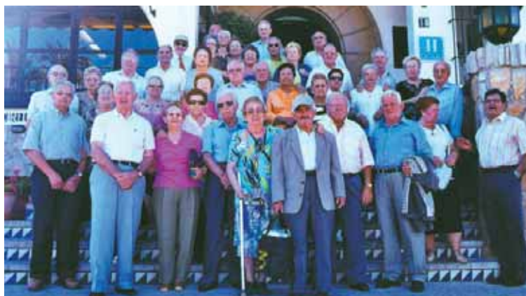
Foto de grup de les parelles que enguany han fet els 50 anys de casats

Un any més l'Ajuntament ha organitzat un acte d'homenatge a les parelles del municipi que han fet 50 anys de casats. Enguany s'han inscrit 24 parelles: 4 del barri de la Mina, 12 de Sant Adrià Nord, 4 del Besòs i 4 de Sant Joan Baptista. De les 24 parelles, 20 van fer el viatge a Peníscola que l'Ajuntament va organitzar els dies 4, 5 i 6 d'octubre. Durant la seva estada els participants van tenir oportunitat de conèixer aquesta localitat i el seu entorn i van poder gaudir d'una excursió a Morella i una visita al castell del Papa Luna. ■