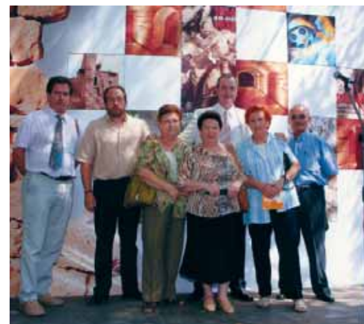
Els quatre testimonis amb l'alcalde i regidors