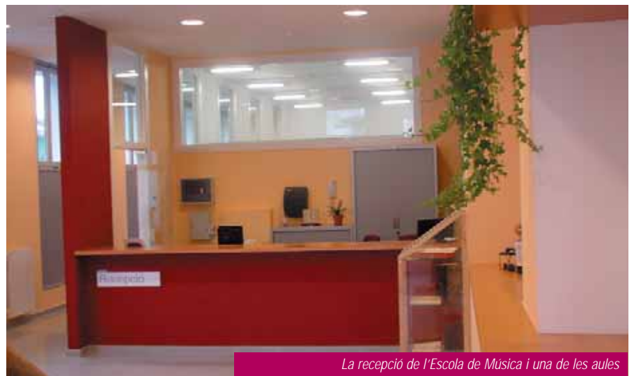
La recepció de l'Escola de Música i una de les aules