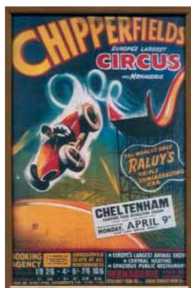
Un Cartell antic del Circ Raluy