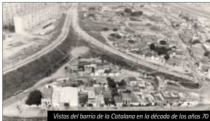
Vistas del barrio de la Catalana en la década de los años 70

Para ejecutar el plan se deberá constituir una junta de compensación, que estará formada por los propietarios mayoritarios del sector, Residencial Urbemar S.A y el Consell Comarcal del Barcelonès. Esta junta se encargará del proyecto de reparcelación que establecerá los beneficios y las cargas de los propietarios y de ejecutar las obras de urbanización.