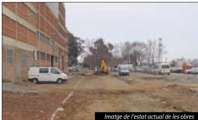
Imatge de l'estat actual de les obres

Durant el mes de febrer es van iniciar les obres d'urbanització del carrer Rafael Casanova i del tram del passeig de la Pollancreda, comprès entre els carrers de Sant Joan i del Besòs. Les obres consisteixen en l'arranjament del passeig que es prolonga fins arribar al terme municipal de Santa Coloma de Gramenet. L'actuació se centra en l'adequació dels serveis, la supressió de barreres arquitectòniques i la plantació d'arbrat. Es proposa una calçada amb dos sentits de circulació amb zones d'aparcament i càrrega i descàrrega. Es preveu que les obres durin uns sis mesos.