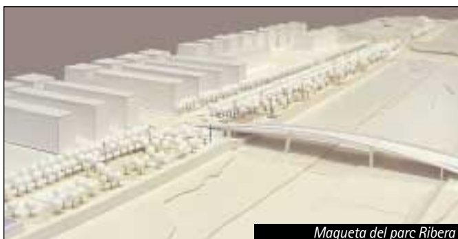
Maqueta del parc Ribera

més dur, on s'incorporen cistelles de bàsquet. Al llarg de tot el parc es potencia el carril bici.