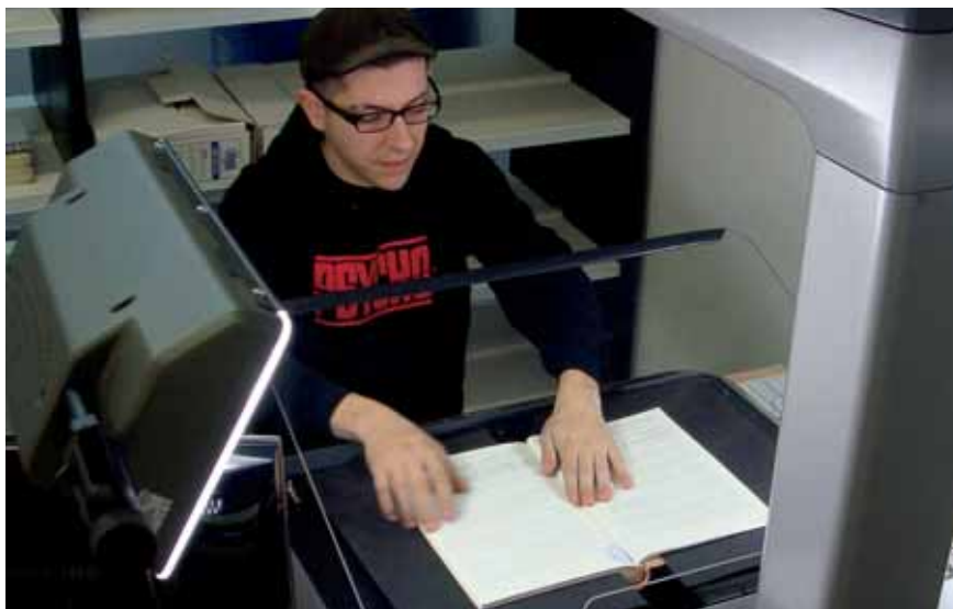
Un tècnic de l'empresa Artyplan realitza la digitalització dels llibres d'actes en les instal·lacions de l'Arxiu Municipal

El proper 28 de maig se celebrarà a Sant Adrià el seminari internacional Reciclatges: la