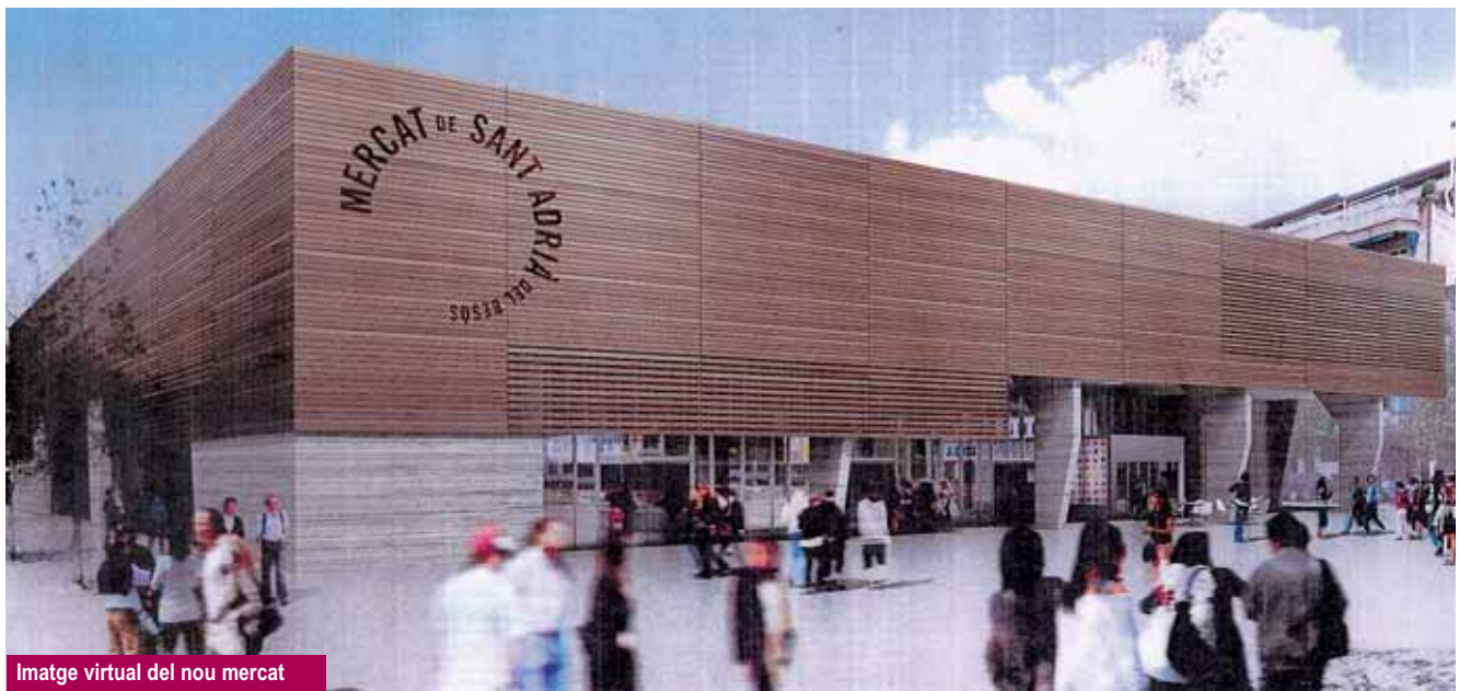
Imatge virtual del nou mercat

Posteriorment es convocarà el concurs per participar en el procés de concessió de les parades. Un cop adjudicades s'iniciarà, d'una banda, la instal·lació de la carpa provisional on s'ubicaran els comerciants de l'actual mercat d'abastaments, i d'altra banda, s'encetarà el concurs d'adjudicació de l'obra i a continuació la construcció del nou edifici. Es preveu que aquestes actuacions comencin abans que acabi l'any.