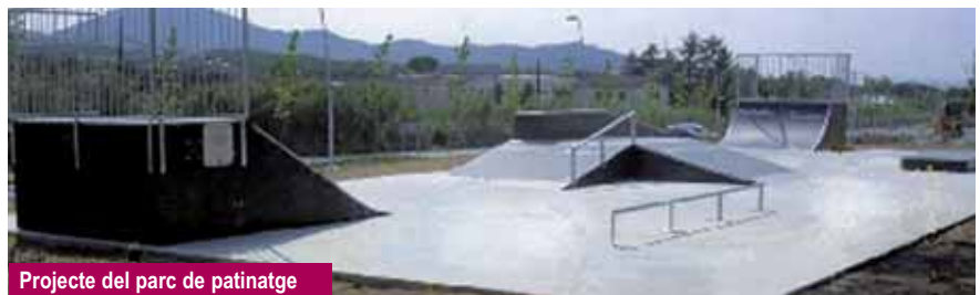
Projecte del parc de patinatge

La inauguració de la pista està prevista per a la primera quinzena d'aquest mes